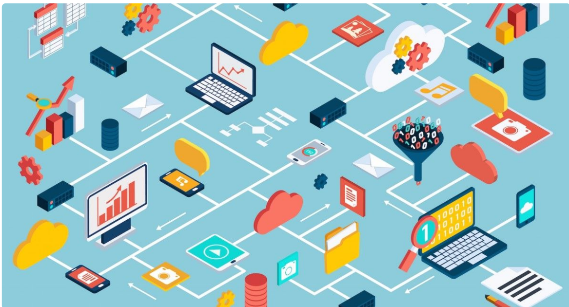
Ilustrasi big data

Kualitas data yang baik merupakan hal yang krusial dalam pemanfaatan data untuk keperluan bisnis. Data yang akurat, terpercaya, dan relevan akan memberikan hasil yang lebih optimal dalam proses pengambilan keputusan. Dalam meningkatkan kualitas data, perusahaan harus memiliki kebijakan dan prosedur yang baik dalam pengumpulan, pemrosesan, dan validasi data. Sumber data yang beragam dan terintegrasi juga menjadi faktor penting dalam menghasilkan wawasan yang komprehensif.